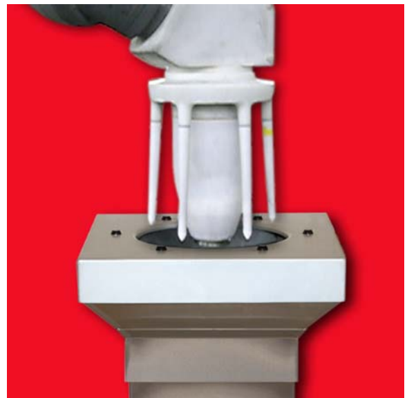
Utilisation avec un applicateur en apparence chargé.